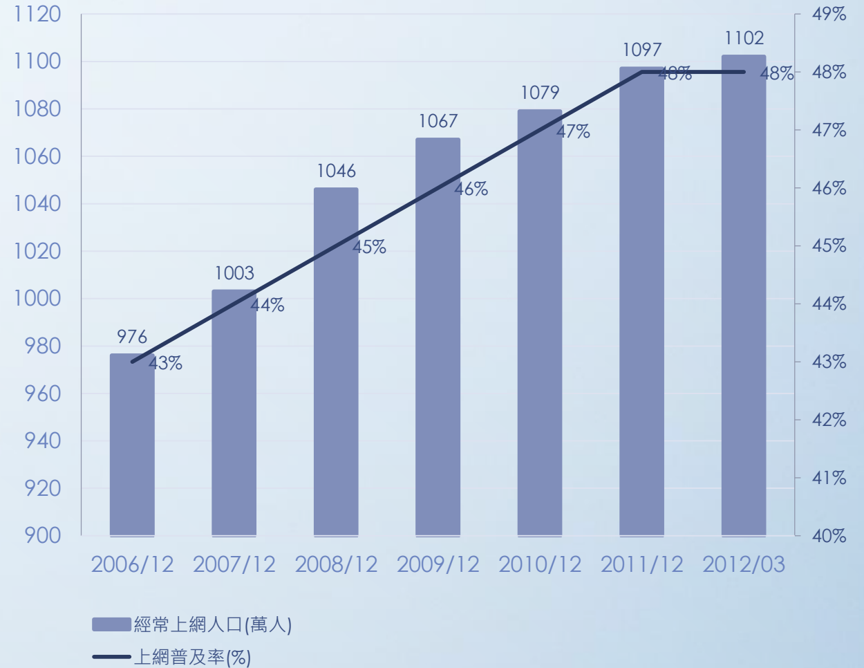
台灣經常上網人口成長情況